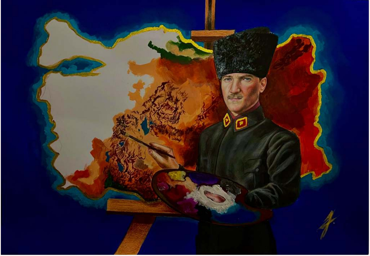
“Sanatının ustası” Kâğıt üzreine akrilik, kuruboya